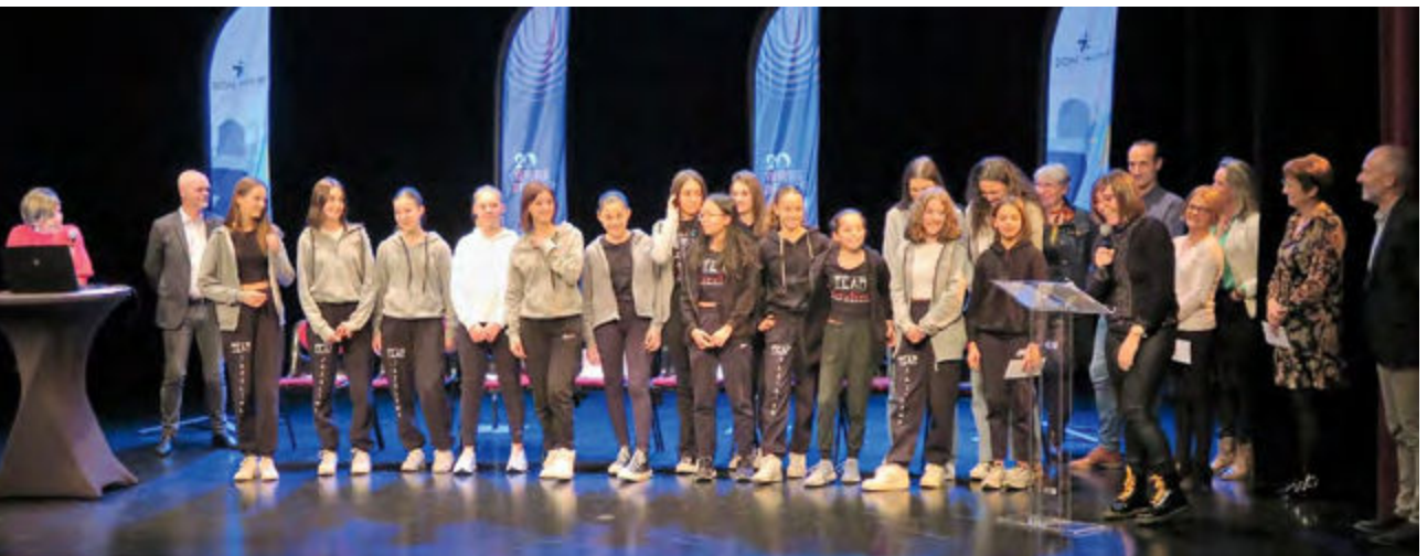
Les danseuses de Jazzline récompensées