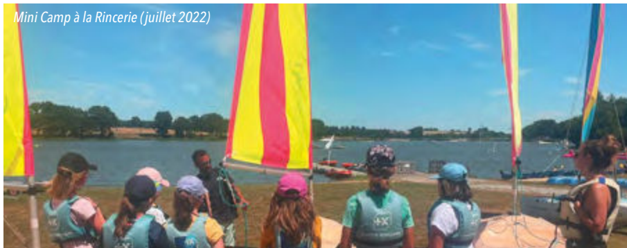
Mini Camp à la Rincerie (juillet 2022)

Afin de répondre aux attentes des familles, une nouvelle organisation est mise en place pour les activités Cocktail sports, Anim'jeunes et à l'Espace jeunes, pendant les vacances scolaires. Inscriptions jusqu'au 22 janvier pour les vacances de Février.